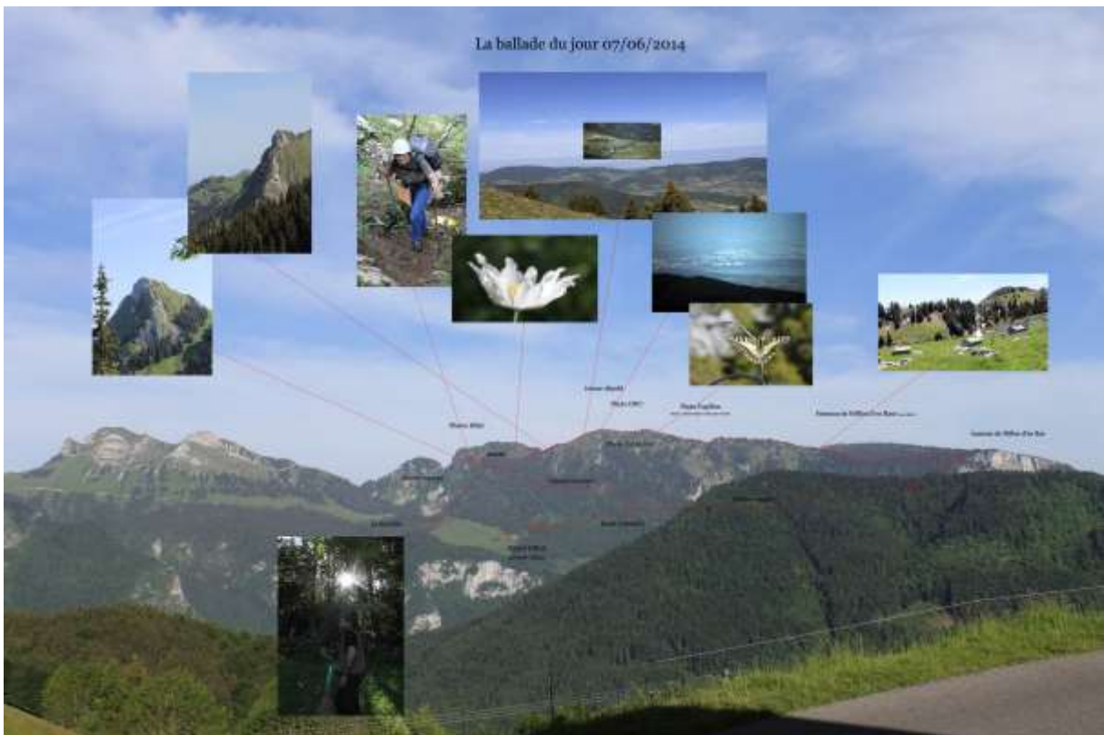
Vue du Col du Feu, par LM